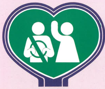
山口県交通安全 シンボルマーク