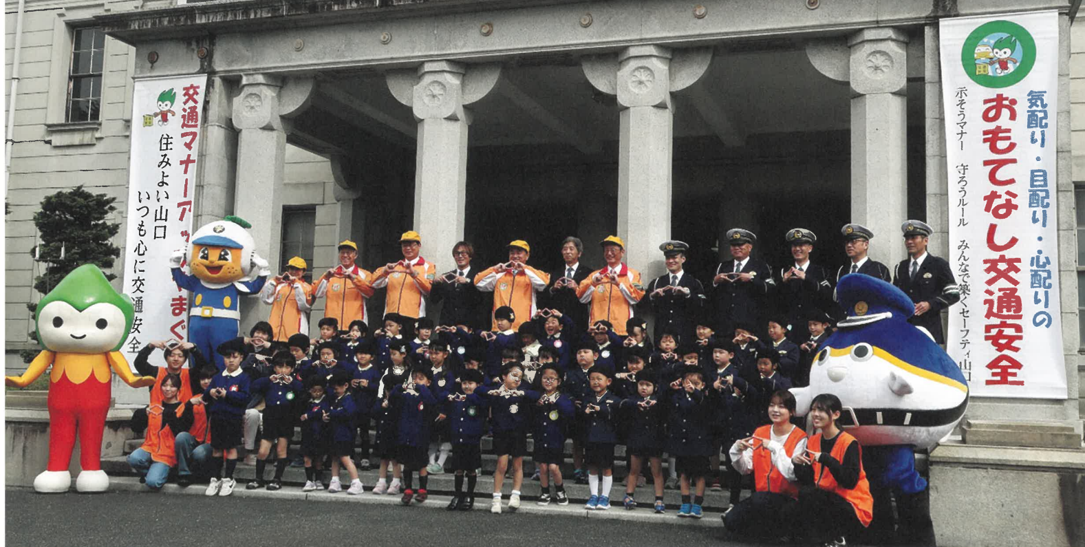
春の全国交通安全運動出発式