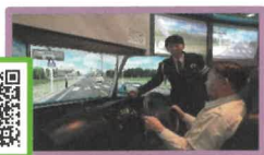
四輪車事故体験シミュレータ （有料：300円）