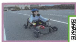
おもしろ自転車 （有料：30分 100円）