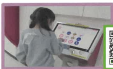
交通安全クイズ「タッチくん」